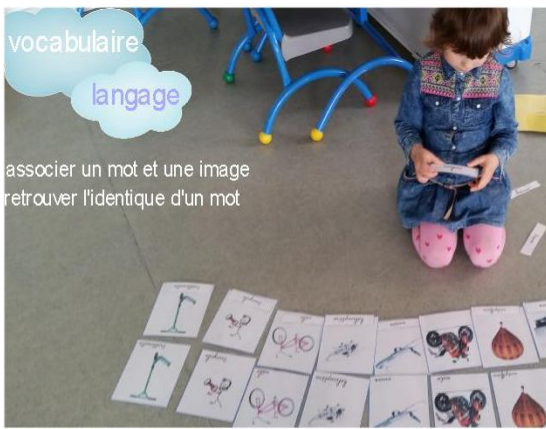
Le coin langage: activités de lecture et de vocabulaire