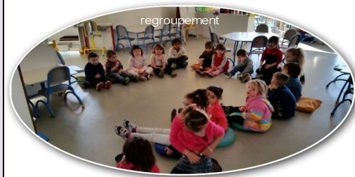
Regroupements: utilisation de l'espace libéré